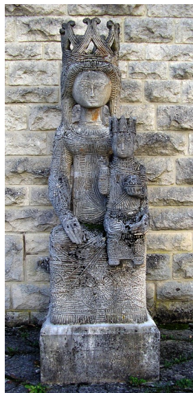
Vierge en majesté de Maurice Calka Bayonville

Le dimanche 26 juin après-midi nous renouerons avec notre habituelle animation "Patrimoine de Pays". Des villageois de Bayonville et des membres de l'ASPV vous présenteront le riche patrimoine de la commune et son histoire ainsi que ses activités artisanales et artistiques. De bons moments en perspective dont nous reparlerons en temps voulu.