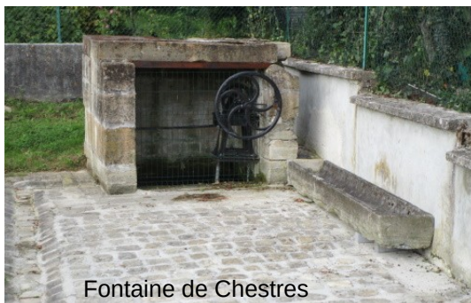
Fontaine de Chestres