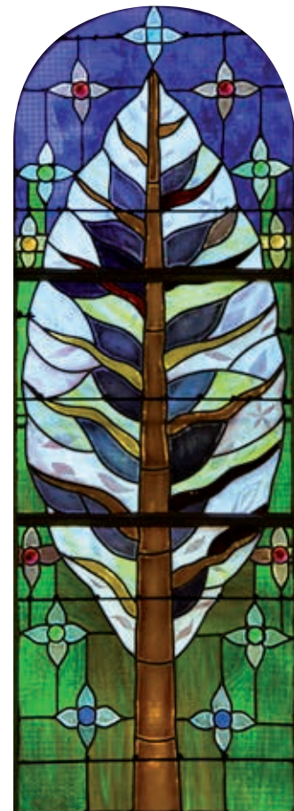
Création "L'Arbre de vie" - J.M Paguet à Brières. 2019

Dimanche 12 septembre Animations de 14h à 19h. Entrée gratuite